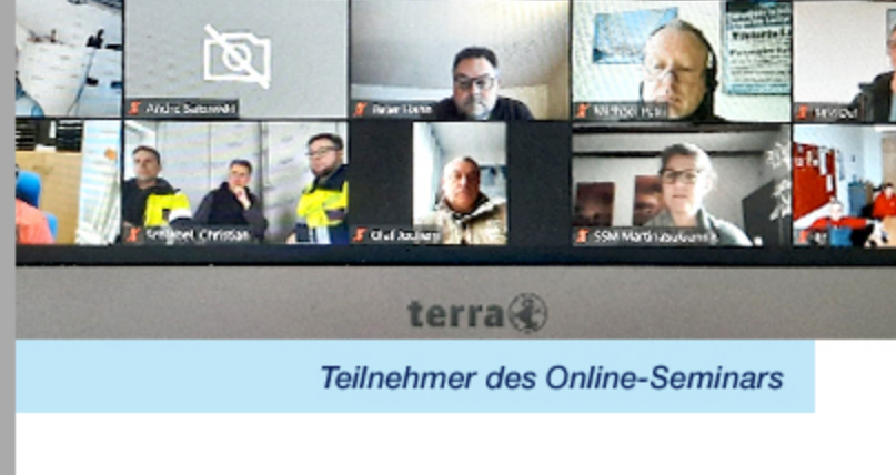
Teilnehmer des Online-Seminars

Die Veranstaltung zählt – wie das Digitale Netzwerktreffen sowie die Betriebsrats- und Personalratslotsenunterstützung – zu unseren kostenlosen Angeboten, um Eure Arbeit vor Ort zu unterstützen. Die Termine werden regelmäßig auf unserer Internetseite veröffentlicht. Hier einige Eindrücke und Impressionen vom 26. Januar 2023.