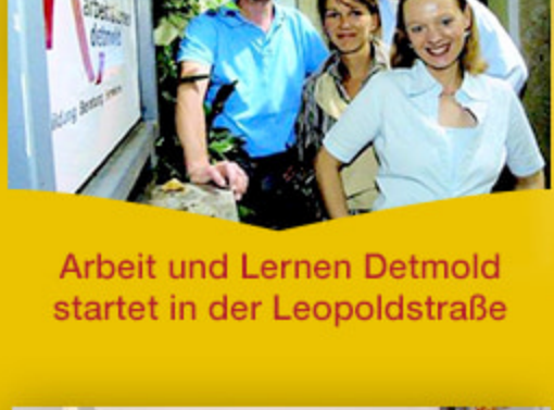
Arbeit und Lernen Detmold startet in der Leopoldstraße