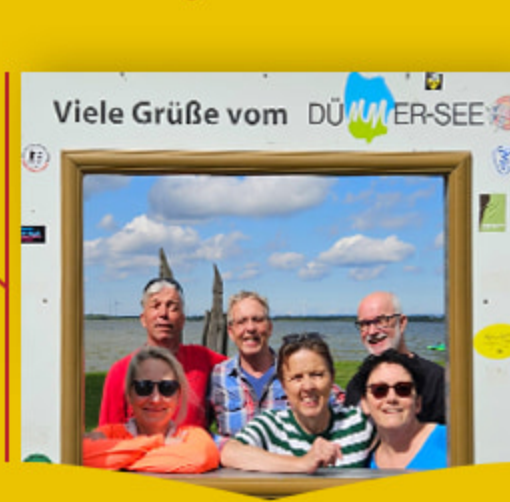
Das Team ist ordentlich gewachsen