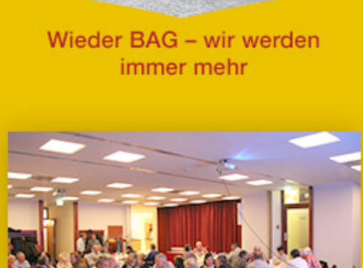
Wieder BAG – wir werden immer mehr