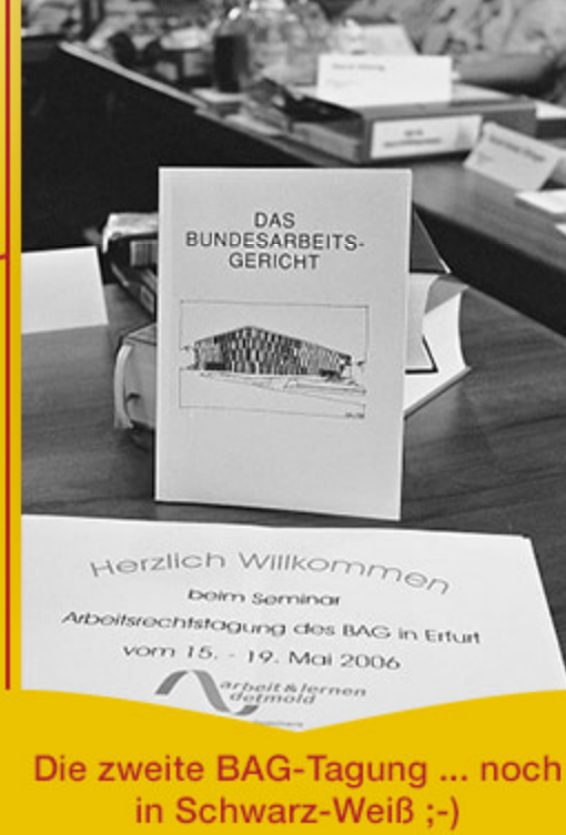
Die zweite BAG-Tagung ... noch in Schwarz-Weiß :-)