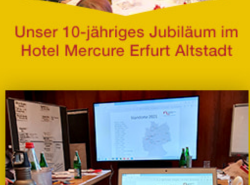
Unser 10-jähriges Jubiläum im Hotel Mercure Erfurt Altstadt