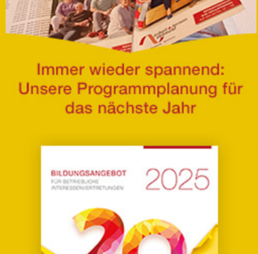
Immer wieder spannend: Unsere Programmplanung für das nächste Jahr