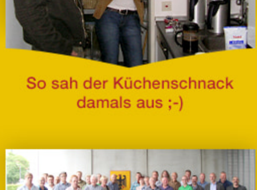
So sah der Küchensnack damals aus :-)