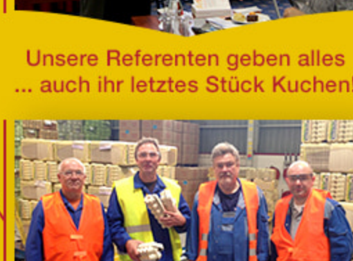
Unsere Referenten geben alles ... auch ihr letztes Stück Kuchen!