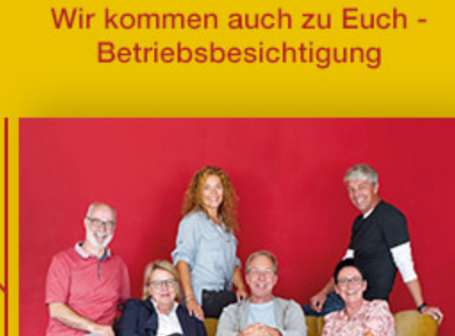
Wir kommen auch zu Euch - Betriebsbesichtigung